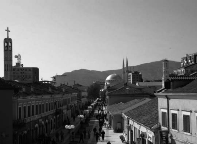
Scutari: da sinistra, la chiesa cattolica dei francescani, la moschea e il campanile della chiesa ortodossa.

Guardando Scutari dal cielo salta all'occhio la vicinanza tra la cattedrale cattolica di Santo Stefano, la cattedrale ortodossa della Natività e la moschea musulmana.